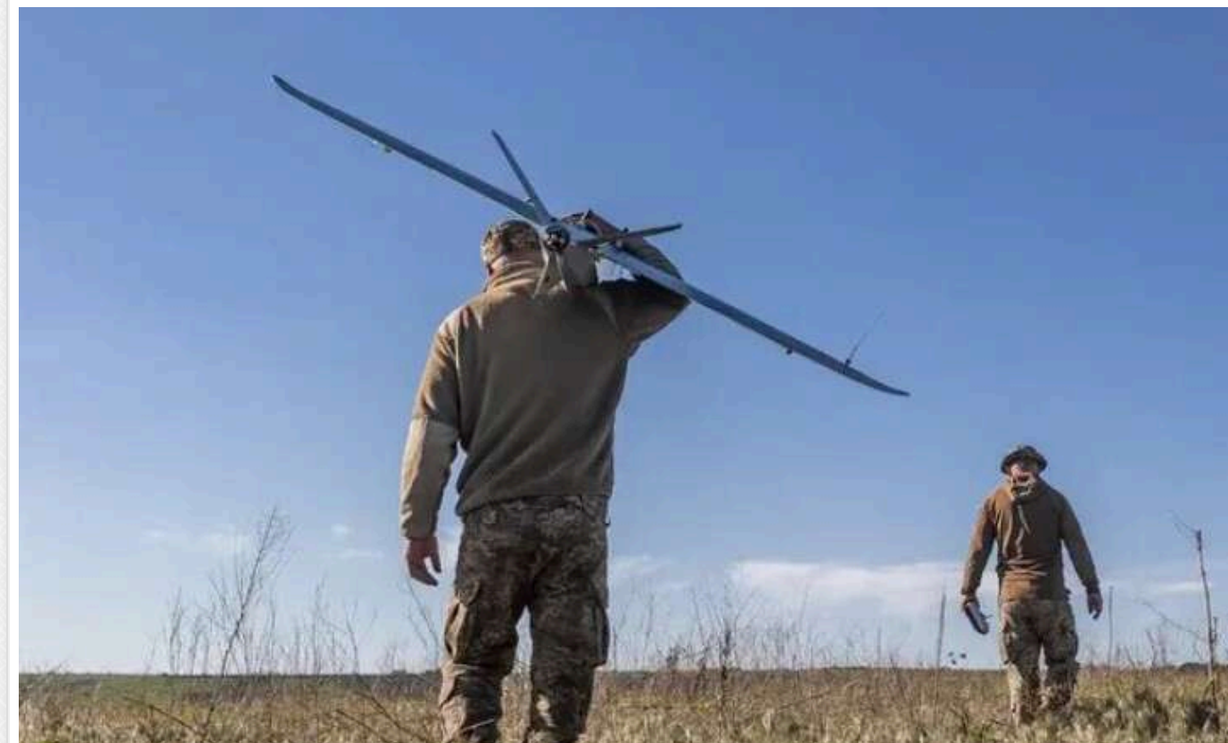
Українські БПЛА вдруге за тиждень здійснили атаку на Новошахтинський НПЗ і «протестували» протиповітряну оборону окупованого Криму

Українські воїни в ніч з 22 на 23 жовтня знову атакували Новошахтинський НПЗ у Ростовській області РФ, це вже вдруге за тиждень. На завод спрямували щонайменше чотири безпілотники, які, за заявами місцевої влади, були "збиті".