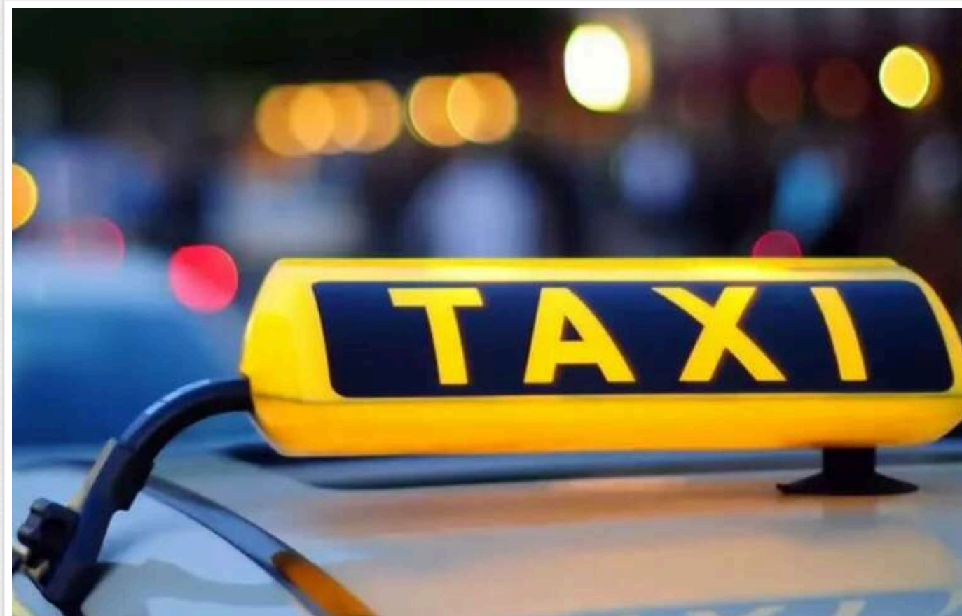
В асоціації таксі відреагували на заяву перевізника Uklon щодо «домовленості» про нічну роботу

В Асоціації таксі України відреагували на заяву Uklon про досягнення попередніх домовленостей з владою Львова щодо відновлення роботи під час комендантської години.