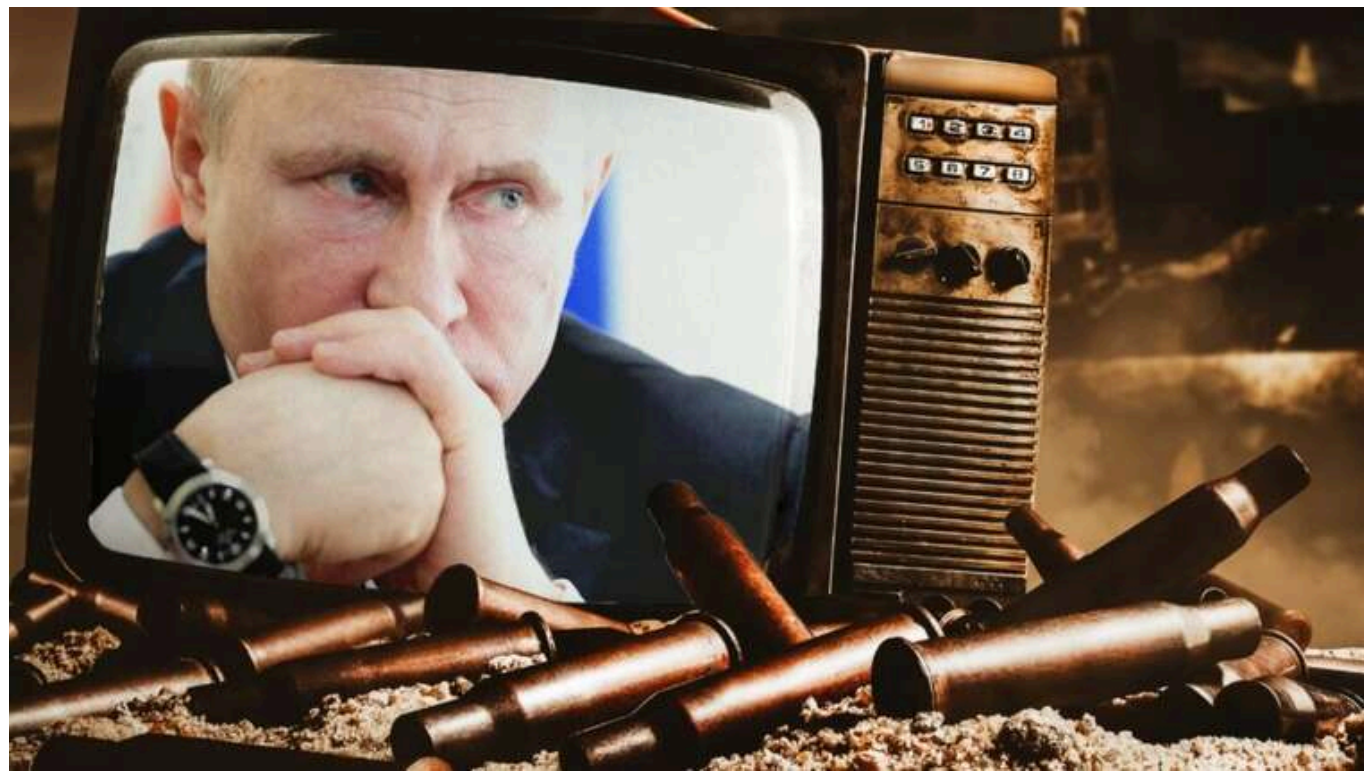
Який «мирний план» Путіна і чого так бояться західні партнери

Попри прання наших західних партнерів якомога швидше припинити війну між Росією та Україною, російська влада не планує зупинити свою військову агресію, намагаючись нав'язати українцям кремлівські умови.