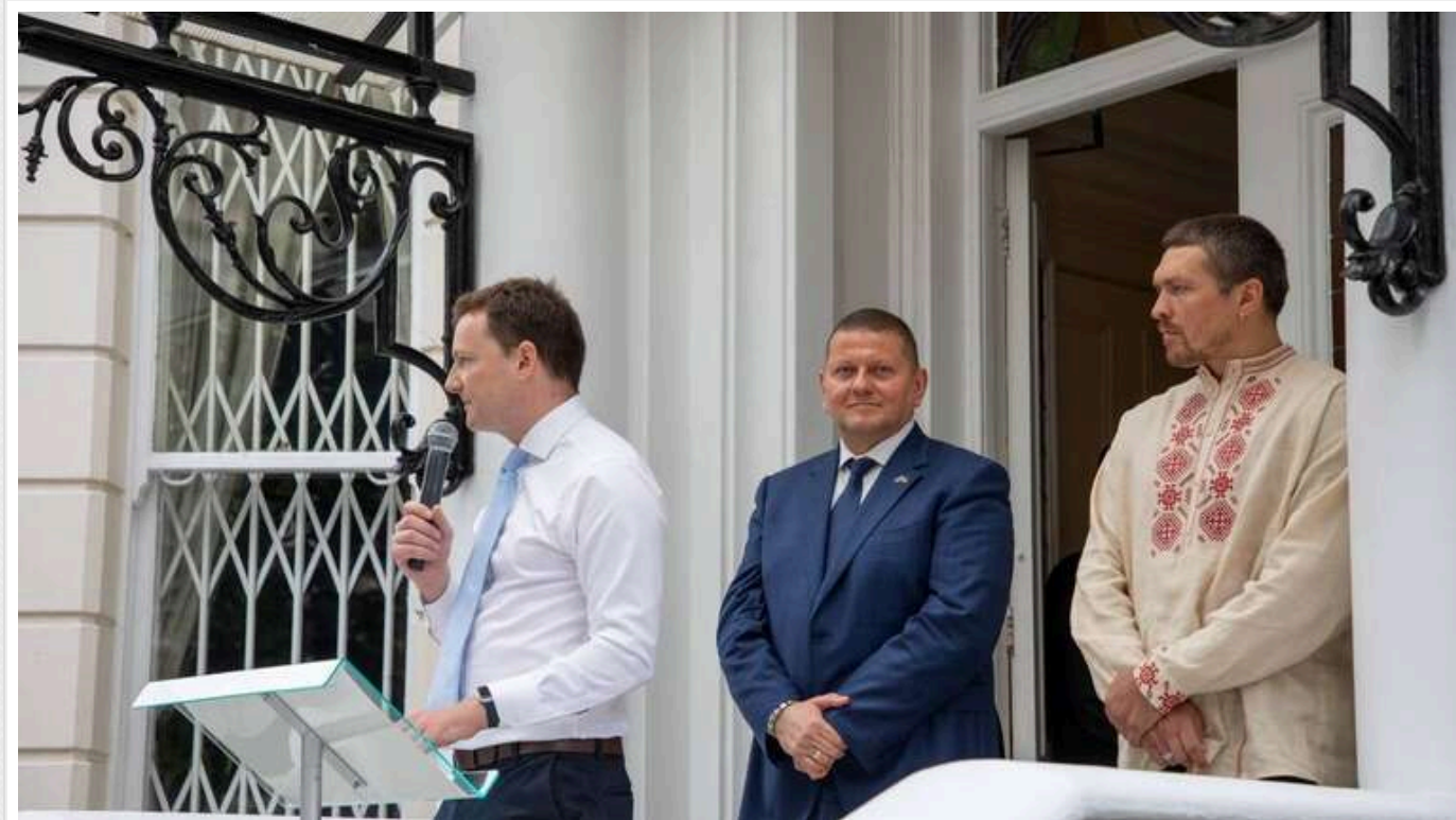
Найвищі 10 зарплат українських послів: Залужний заробляє 60 тисяч гривень на місяць

Журналісти отримали ексклюзивну інформацію від МЗС про зарплати надзвичайних і повноважних послів України в різних країнах світу та склали рейтинг десяти послів із найвищими зарплатами.