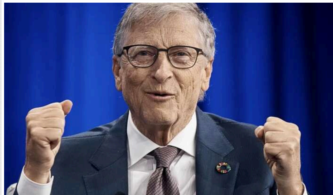
NYT: Білл Гейтс пожертвував 50 мільйонів доларів на кампанію Гарріс

Засновник Microsoft, американський бізнесмен та інвестор Білл Гейтс пожертвував близько 50 мільйонів доларів на виборчу кампанію кандидатки від демократів, віцепрезидентки Камали Гарріс. Цей крок викликаний занепокоєнням Гейтса щодо того, яким буде друге президентство республіканця Дональда Трампа.