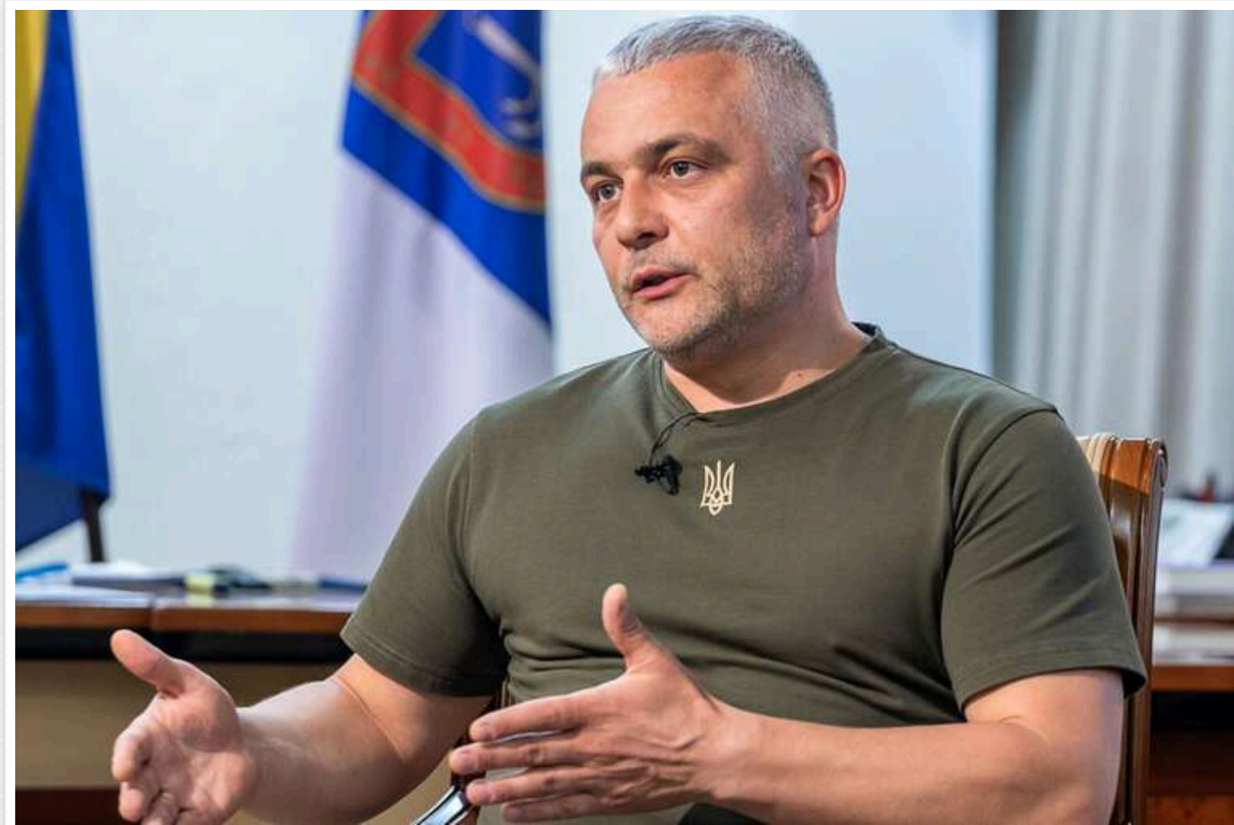
44-річний голова Одеської ОВА Олег Кіпер, який очолював київську прокуратуру, відсудив собі пенсію за вислугу років

Керівник Одеської ОВА, колишній очільник Київської міської прокуратури Олег Кіпер у 2023 році звернувся до суду проти Головного управління Пенсійного фонду України в Чернівецькій області, з метою перегляду стажу і призначення пенсії за вислугу років як працівнику органів прокуратури. Адміністративний позов був частково задоволений, але цього вистачило, аби суд визнав Кіпера офіційним "пенсіонером".