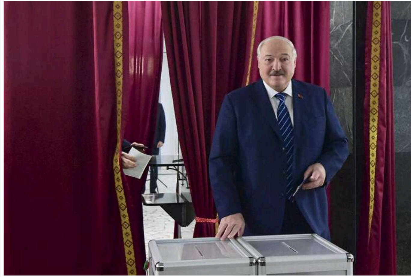
У Білорусі визначили дату проведення наступних "виборів" президента

Наступні вибори президента Білорусі заплановані на 25 січня 2025 року.