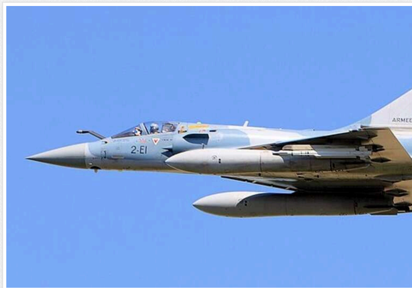
ЗМІ: Україна отримає від Франції три літаки Mirage 2000 на початку 2025 року

Франція вирішила відправити в Україну першу партію з трьох літаків Mirage 2000-5. Вони будуть оснащені крилатими ракетами SCALP та бомбами AASM.