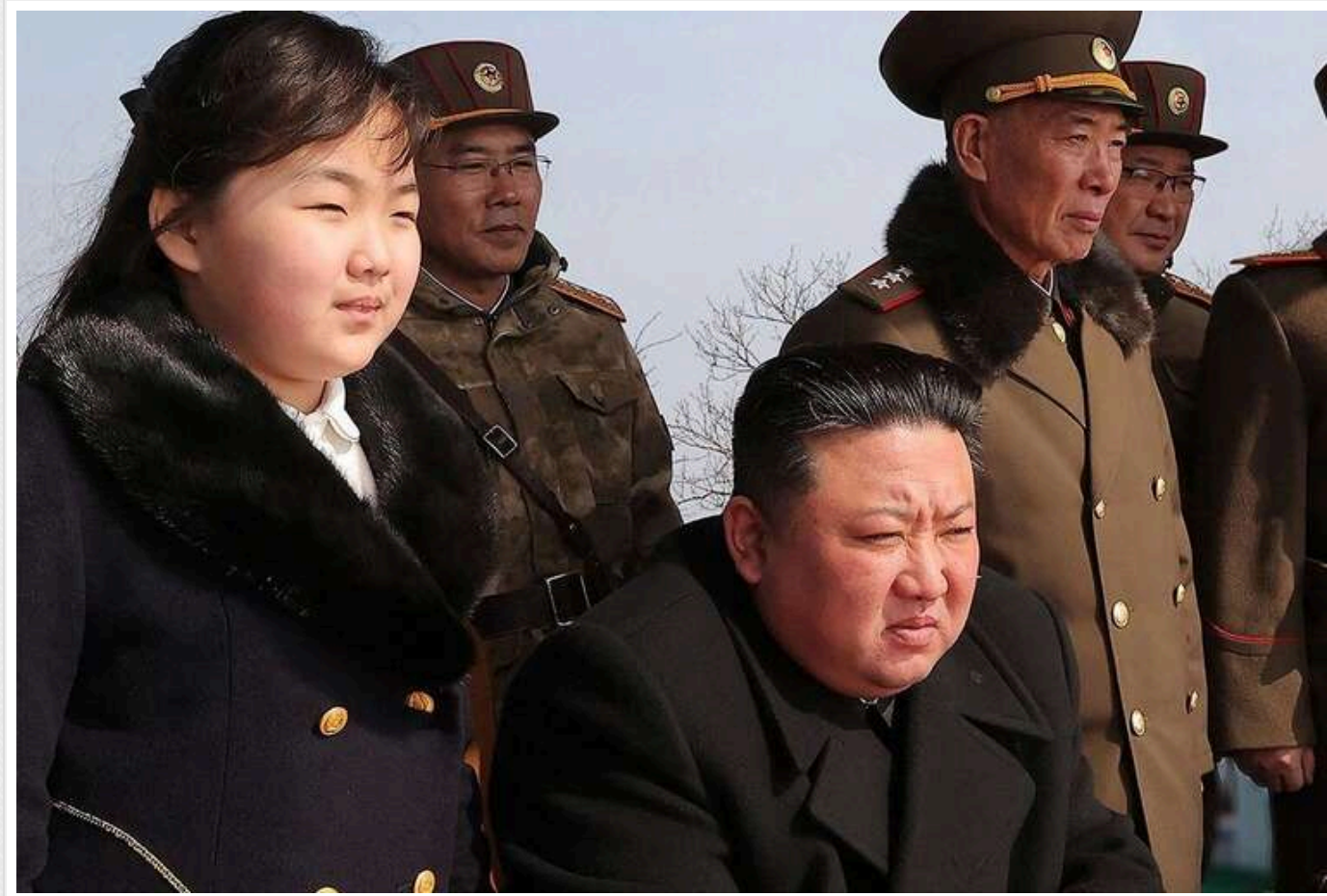
Запасів озброєння Північної Кореї вистачить на 3 місяці, - Yonhap News

Вважається, що Північна Корея запаслась військовими ресурсами, яких може вистачити на три місяці в разі війни, й активно експлуатує заводи з виробництва боєприпасів, щоб підтримати Росію, повідомив один із парламентаріїв.