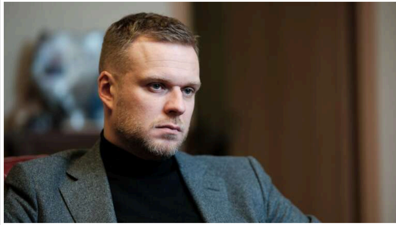
Литва запропонувала відправити в Україну війська ЄС у відповідь на присутність солдатів КНДР в РФ

Європейські країни повинні знову розглянути ідею французького президента Емманюеля Макрона щодо розміщення військ в Україні. Ця ідея стає актуальною, адже тисячі північнокорейських солдатів можуть незабаром приєднатися до Росії для участі у війні.