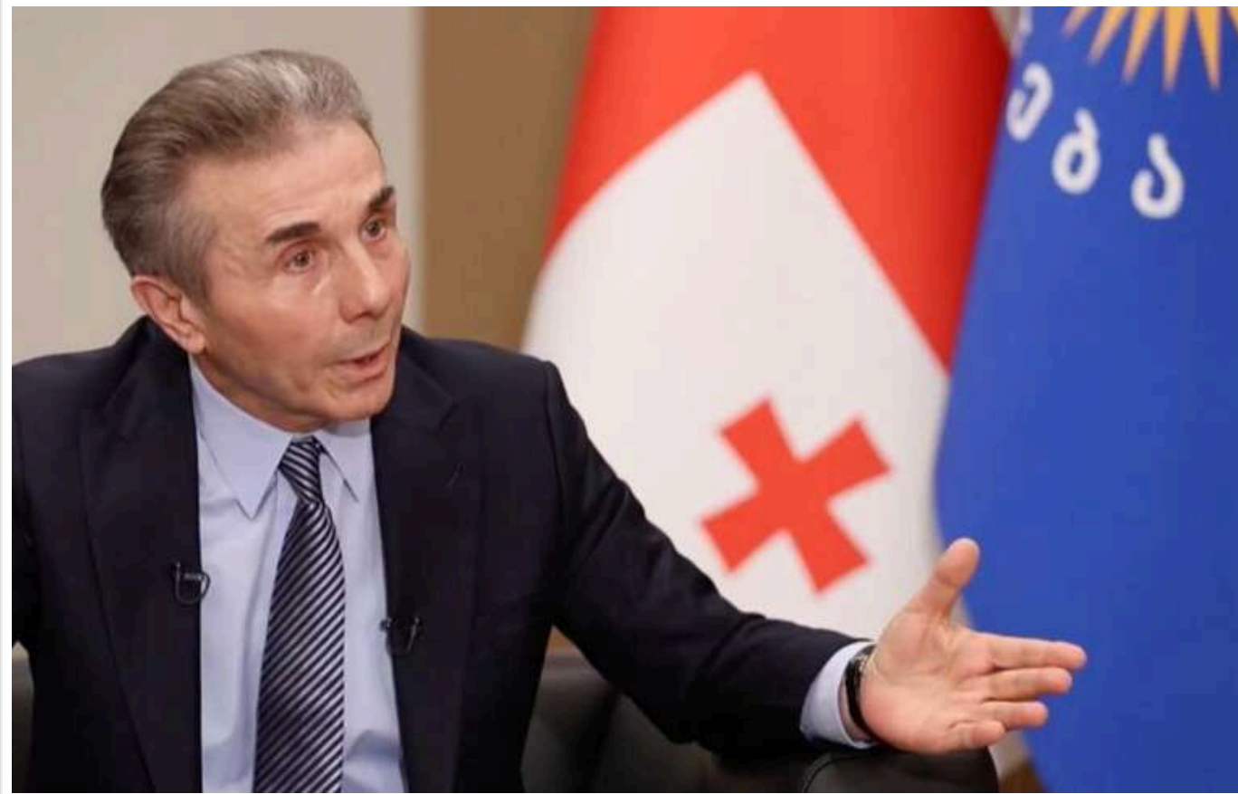
У Грузії стверджують, що Україну та Грузію в 2008 році не прийняли в НАТО з метою, щоб вони були "живою силою" в конфліктах проти РФ

Грузинський олігарх і почесний голова керівної партії Бідзіна Іванішвілі стверджує, що рішення тоді було ухвалене не групою країн Альянсу, а з "елементарної причини" однією-двома країнами, які "насправді контролюють НАТО".