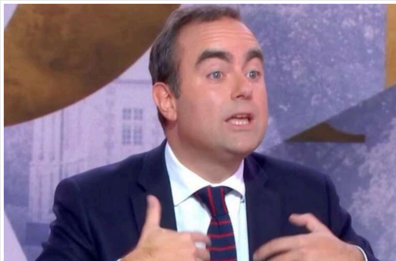
Лекорню запропонував обговорити можливість розміщення в Україні «неядерних сил» Франції після завершення війни

Про це він повідомив в ефірі телеканалу TF1/LCI.