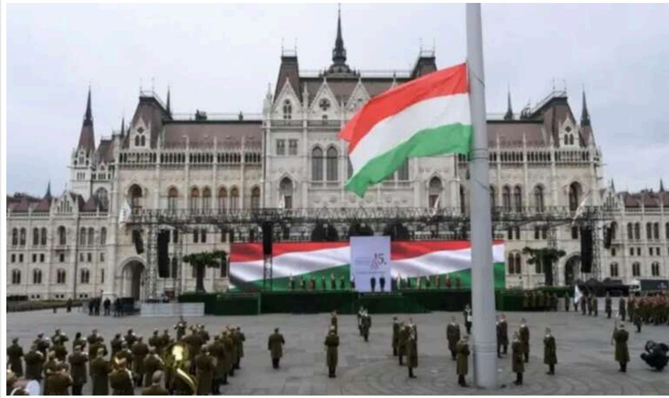
В Угорщині підтвердили, що США поінформували про можливу військову акцію напередодні Дня пам'яті

Уряд Угорщини підтвердив, що Сполучені Штати передали інформацію про можливі провокації зі зброєю під час акції 23 жовтня, присвяченої річниці Угорської революції 1956 року.