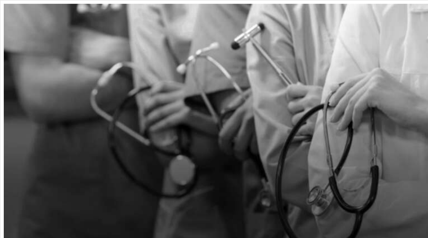
У захопленій Макіївці мирне населення позбавлене доступу до медичних послуг, - ЦНС

У тимчасово окупованій Макіївці набирає обертів ще один скандал. Тут цивільним відмовляють у доступі до медичної допомоги.