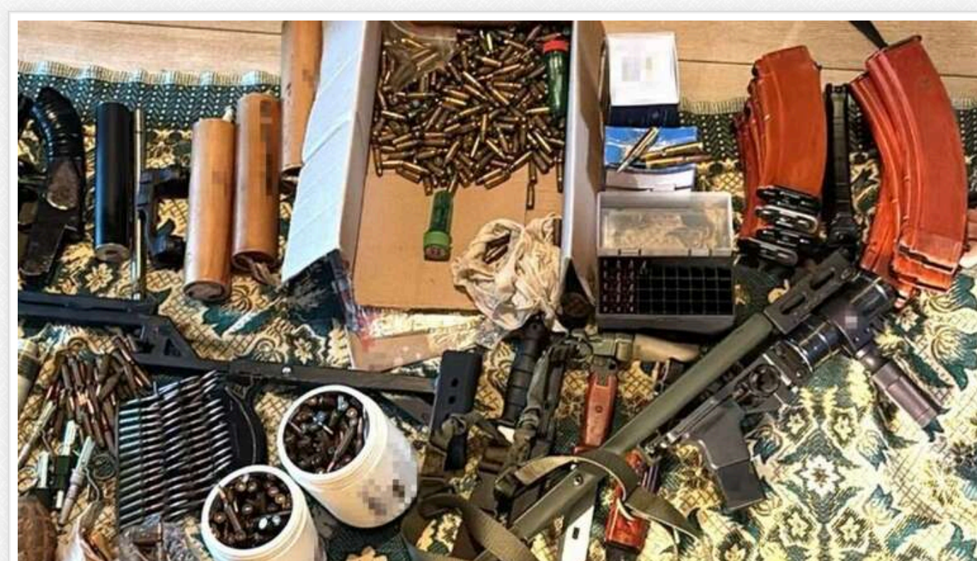
СБУ викрила у кількох регіонах України підпільних торгівців зброєю

Служба безпеки та Нацполіція попередили незаконний обіг зброї в чотирьох регіонах України. Правоохоронці затримали сімох чоловіків, які намагалися торгувати "трофейним" озброєнням російських окупантів у Дніпрі, а також у Закарпатській, Тернопільській та Житомирській областях.