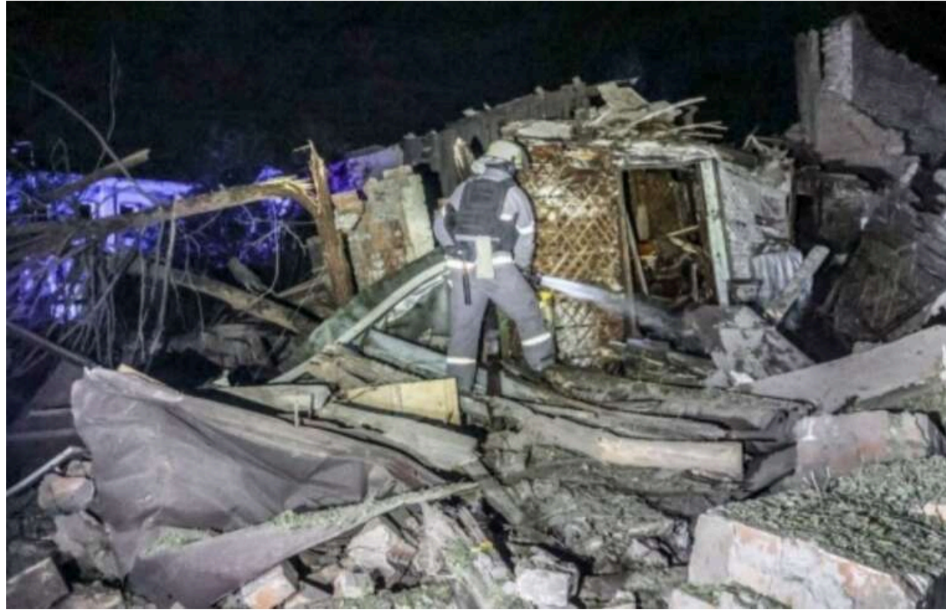
Внаслідок російського авіаудару по Харкову було пошкоджено 47 житлових будинків

Внаслідок російського авіаудару по Харкову ввечері 20 жовтня були пошкоджені 47 житлових будинків - приватних і багатоповерхових.