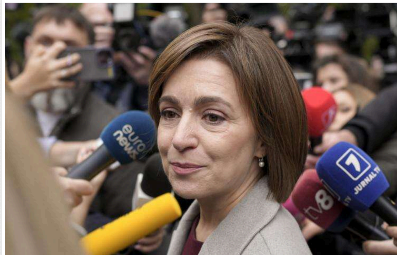
Президентка Молдови пообіцяла внести до Конституції положення про євроінтеграцію

До Конституції Молдови будуть внесені зміни, які стосуються європейської інтеграції.