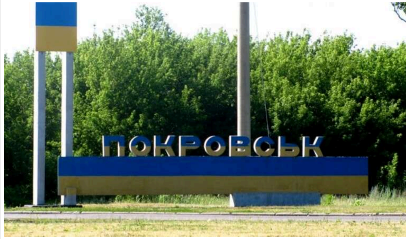
Російські війська відкладають напад на Покровськ, - розвідка Британії

Російські окупанти, швидше за все, не будуть наступати на Покровськ Донецької області до весни наступного року. У найближчі два місяці почнеться сезон бездоріжжя, що ускладнить просування. Проте загарбники спробують оточити це місто.