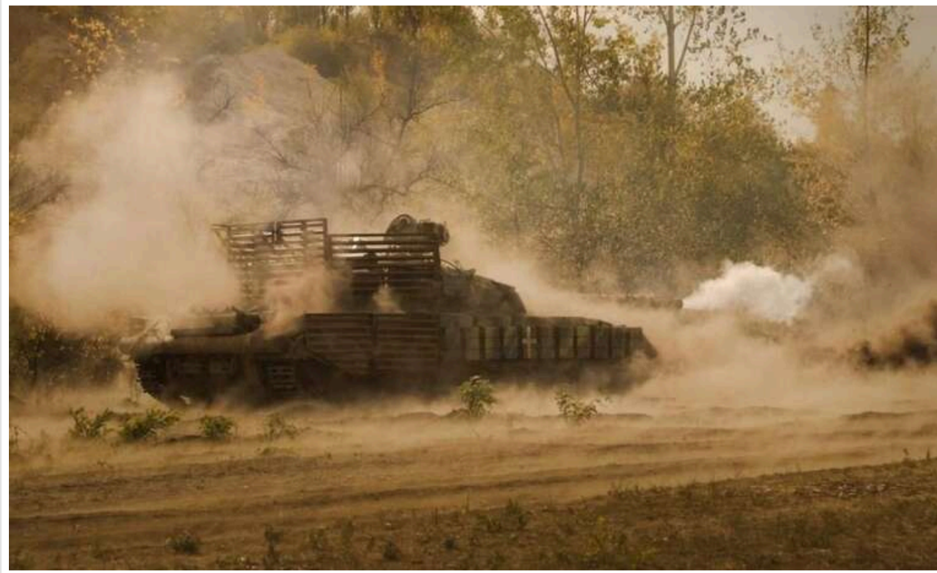
На Курахівському напрямку противник посилює атаки броньованими штурмами, - офіцер ЗСУ

На Курахівському напрямку противник в основному використовує броньовані штурми та атакують практично щоденно.