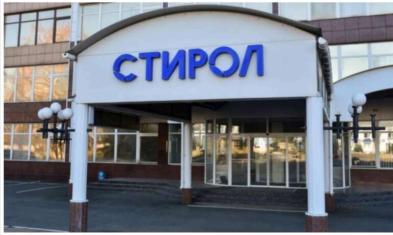
У «ДНР» знову зібralися запускати виробництво мінеральних добрив на заводі «Стирол»

На хімічному заводі "Стирол" в окупованій Горлівці Донецької області нібито планують відновити виробництво мінеральних добрив.