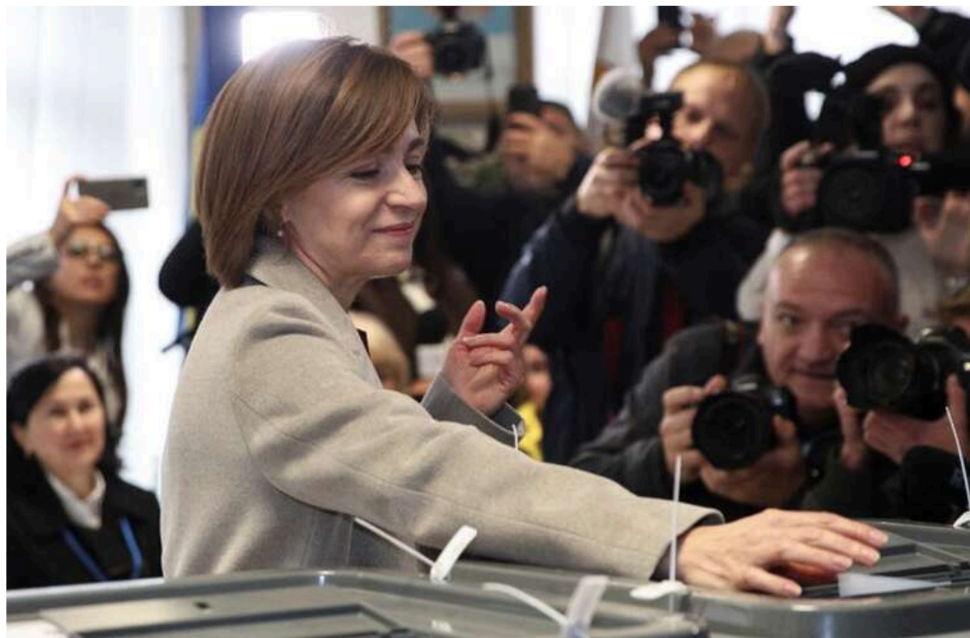
Молдова йде на другий тур виборів президента

У першому турі виборів президента Молдови, який відбувся 20 жовтня, попередні результати Центральної виборчої комісії не обіцяють жодному з кандидатів понад 50% голосів. Очевидно, відбудеться другий тур між Маєю Санду та Олександром Стояногло.