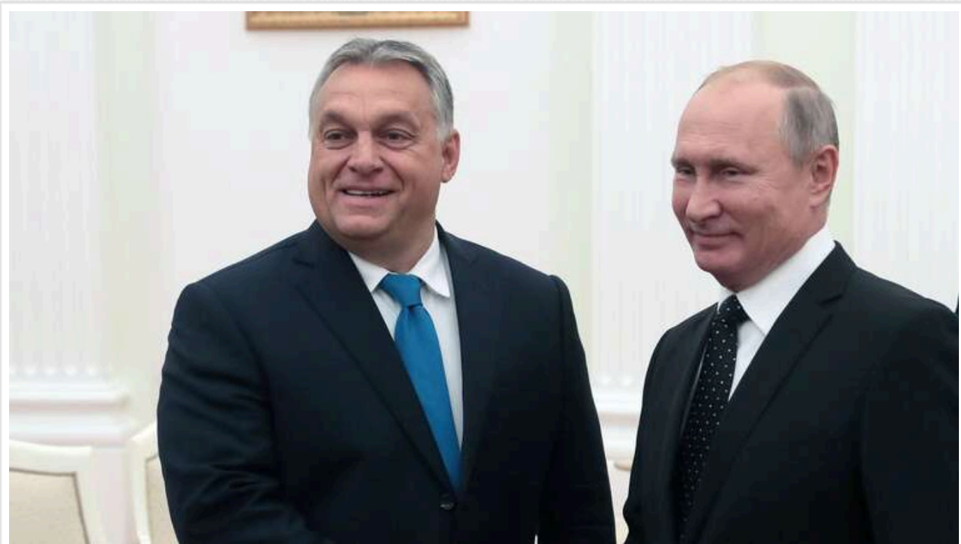
Politico: ЄС повернеться до нових санкцій проти Росії у січні

Європейський Союз планує відновити обговорення санкцій проти Росії в січні 2025 року, після того, як Польща перейме головування в ЄС від Угорщини.