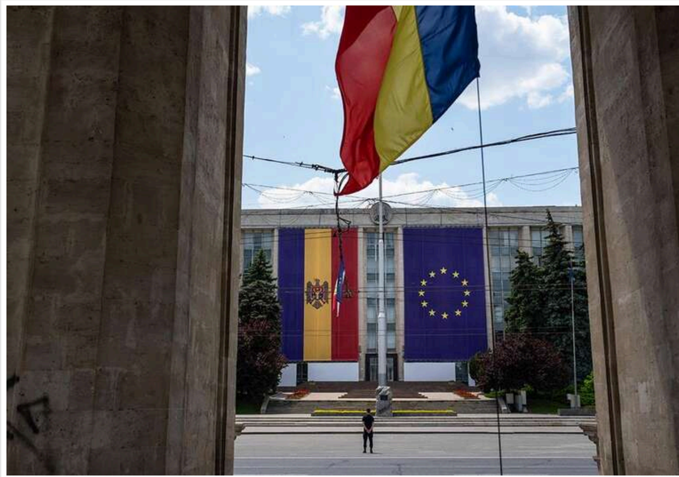
Референдум за вступ до ЄС: більшість районів Молдови проголосували проти

У більшості районів Молдови на референдумі було висловлено незгоду з перспективою вступу до ЄС, хоча загалом з невеликою перевагою лідирують прихильники євроінтеграції.