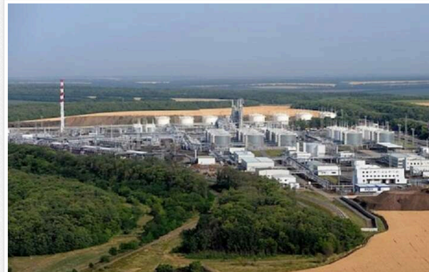
В РФ вночі чули вибухи: під прицілом міг бути Новошахтинський НПЗ у Ростовській області

У ніч на понеділок, приблизно о 3 годині, в Ростовській області пролунали вибухи. Цілою міг бути Новошахтинський нафтопереробний завод (НПЗ).