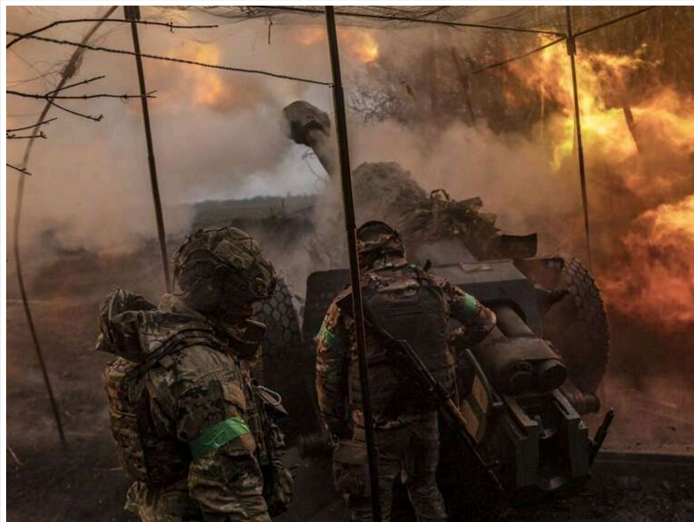
9 морських піхотинців викликали на свою позицію усю вогневу міць Сил оборони, щоб не здаватись у полон: "Всі залишилися живі"

Бійці вирішили направити на свою позицію всю вогневу міць Сил оборони, щоб ліквідувати окупантів і не потрапити в полон.