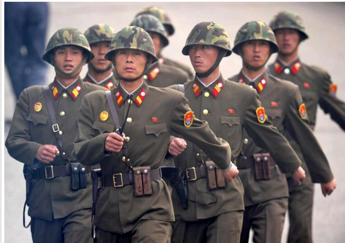
З'явилися нові дані про долю військових із КНДР, які намагалися втекти з позицій на Курщині

Військовослужбовці з Північної Кореї, які намагалися втекти з позицій у Курській області, можуть бути залучені до штурмових дій проти ЗСУ. Деякі північнокорейці вирішили самовільно залишити позиції з метою пошуку командування ЗС РФ.