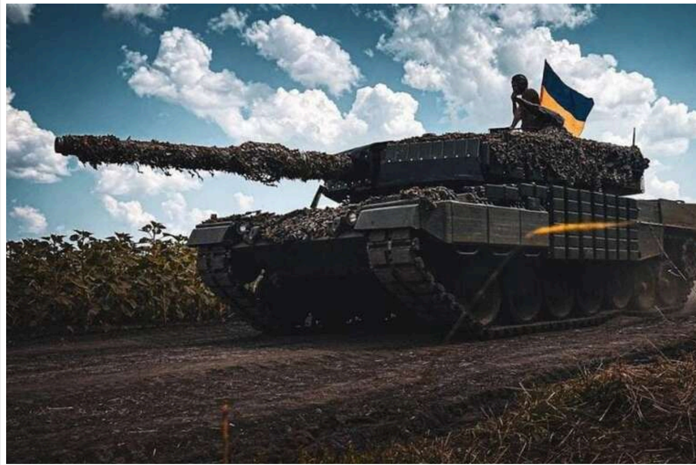
ISW: Сили оборони просунулися на північ від Суджі на Курщині, ЗС РФ проводять контратаки

Нещодавно підрозділи Збройних сил України просунулися на північ від Суджі на тлі бойових дій у Курській області Росії. Тим часом російські пропагандисти спростували свої попередні заяви про "успіхи" їхньої армії.