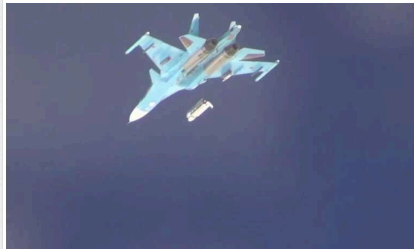
Росія атакувала Харків чотирма авіаційними боеприпасами, попередньо, ФАБ з УМПК і «Гром-Е1», — облпрокуратура