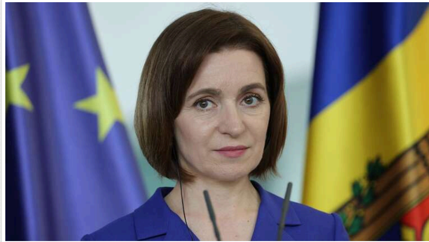
На виборах у Молдові чинна президентка Санду лише трохи випереджає кандидата від опозиції