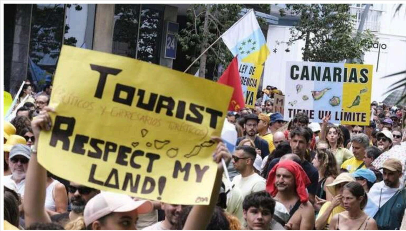
На Канарах тисячі людей вийшли на протести проти перенасиченого туризму

Тисячі людей вийшли на акції протесту в неділю на курортах Канарських островів в Іспанії проти надмірного туризму, який, як вони стверджують, витісняє місцевих жителів з ринку житла.