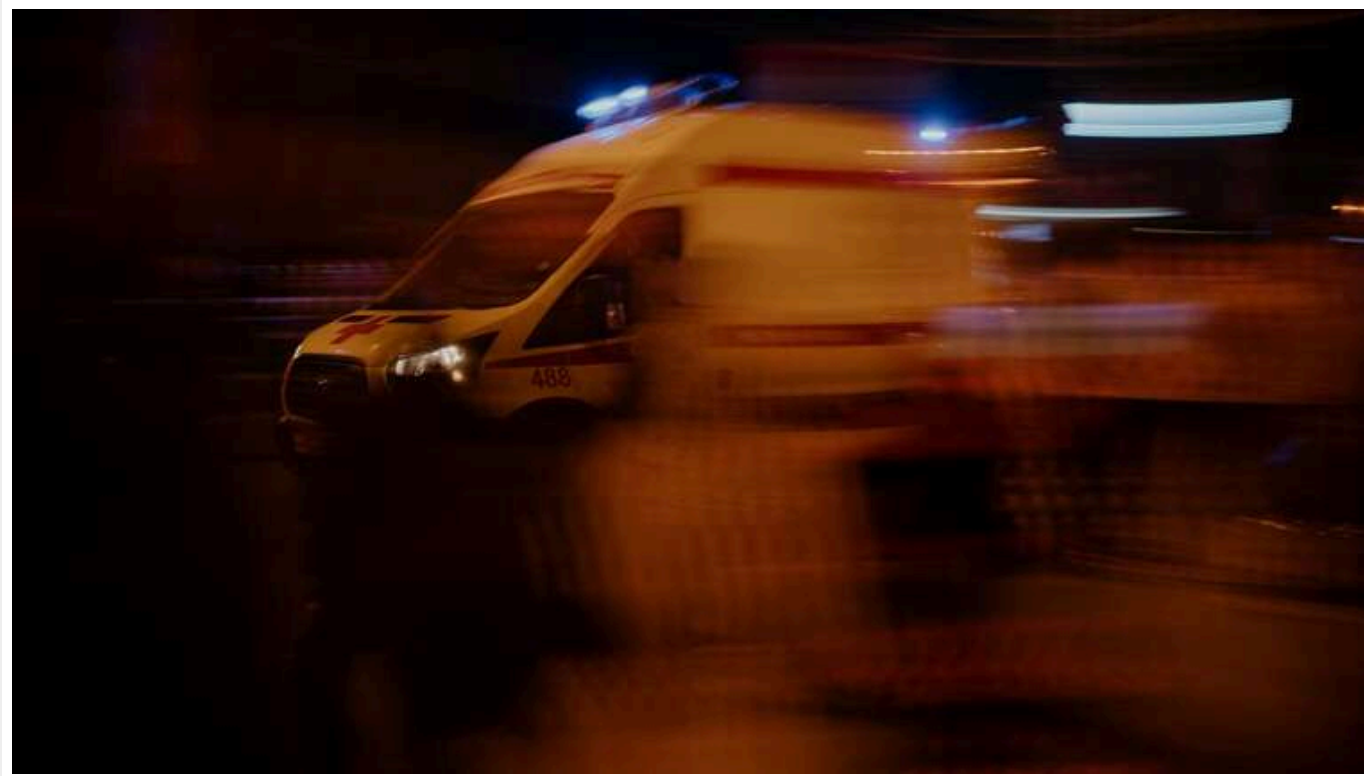
Авіаудар по Харкову: в ОВА озвучили наслідки атаки

Увечері 20 жовтня росіяни здійснили атаку на Харків. Ворог обстріляв житлові райони.