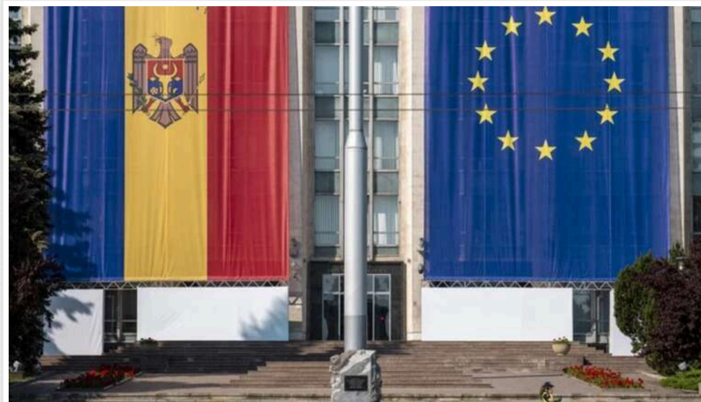
У Молдові опрацьовано 40% голосів: поки більшість проти вступу до Євросоюзу

У Молдові продовжується підрахунок голосів після референдуму щодо закріплення в Конституції курсу на вступ до Європейського Союзу.