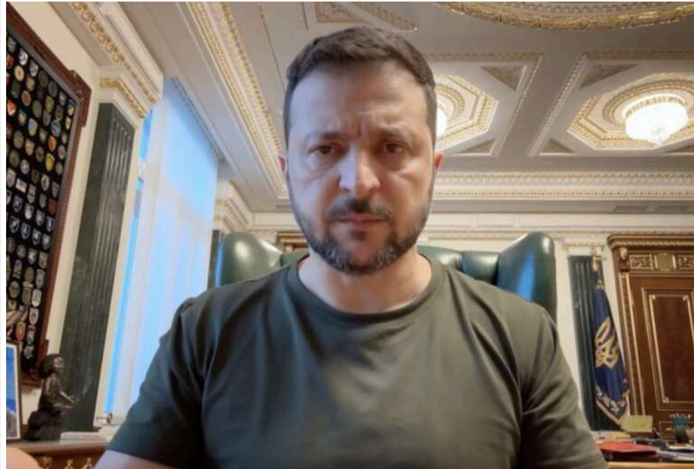
Зеленський закликав союзників протистояти залученню Північної Кореї до війни проти України

Президент Володимир Зеленський закликав західних партнерів протидіяти залученню Росією Північної Кореї до війни проти України.