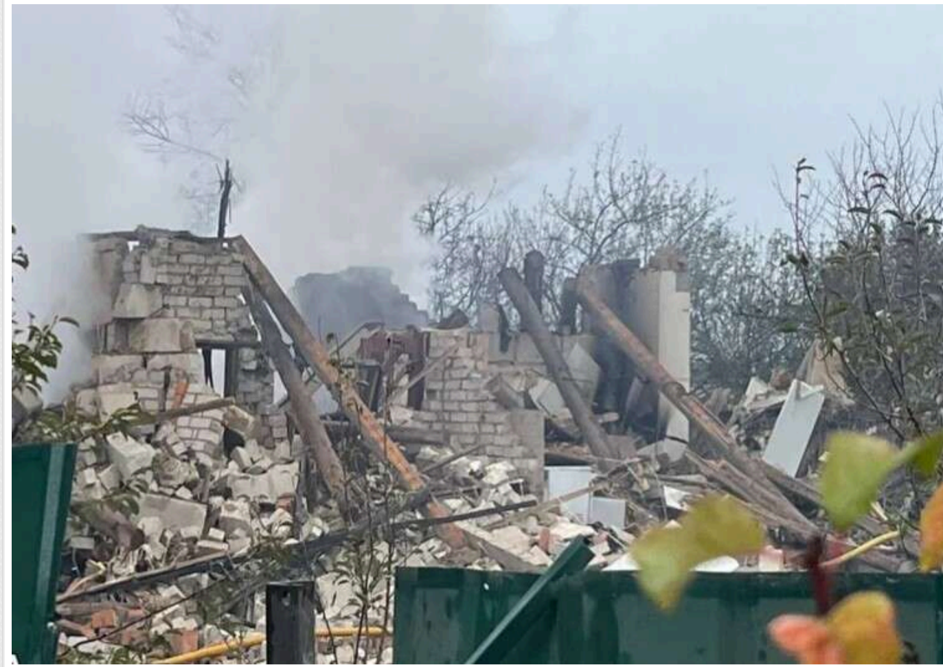
Окупанти атакували Харківську область: загинуло подружжя

20 жовтня російські війська здійснили обстріл Харківської області. Під завалами будинку, в який влучили авіабомби, були знайдені тіла чоловіка та його дружини.