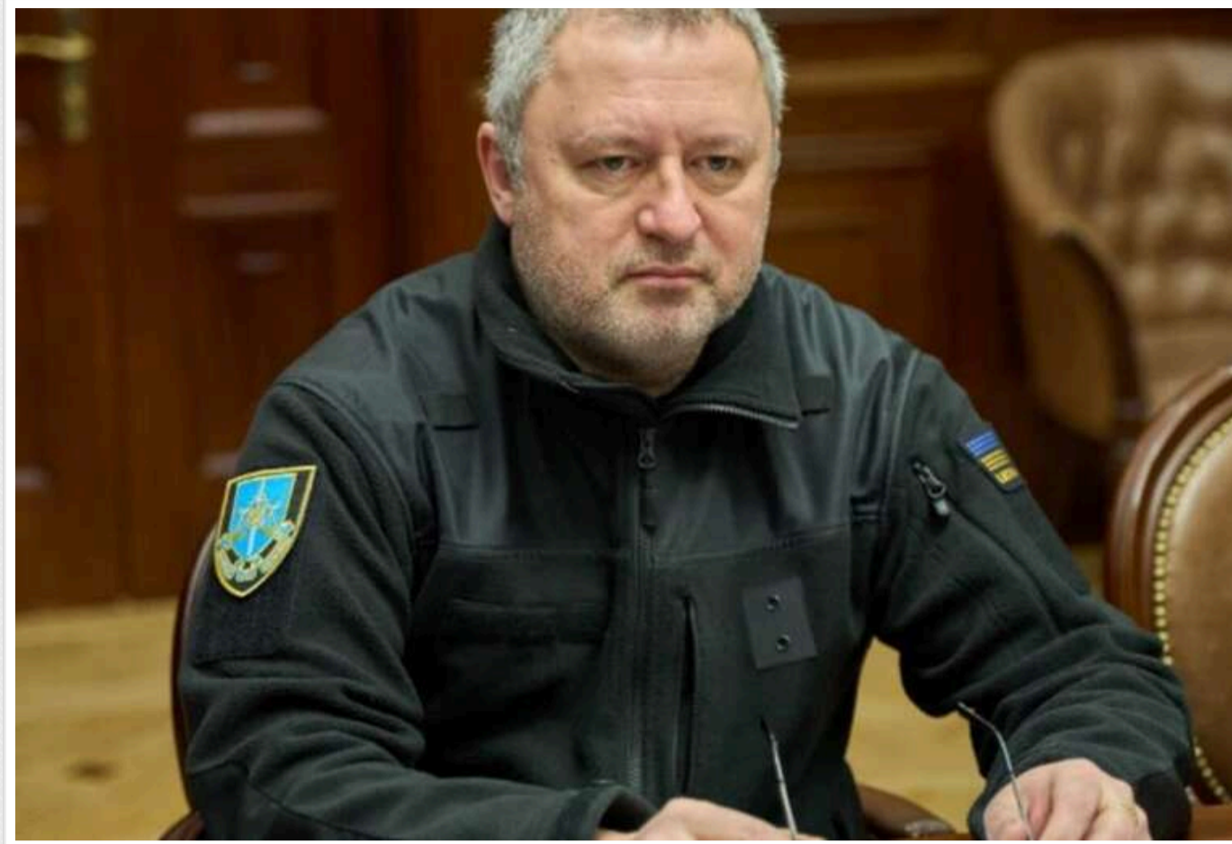
З'явилися перші результати службового розслідування щодо хмельницьких прокурорів

На сьогодні встановлено, що 61 прокурор органів прокуратури Хмельниччини має інвалідність.