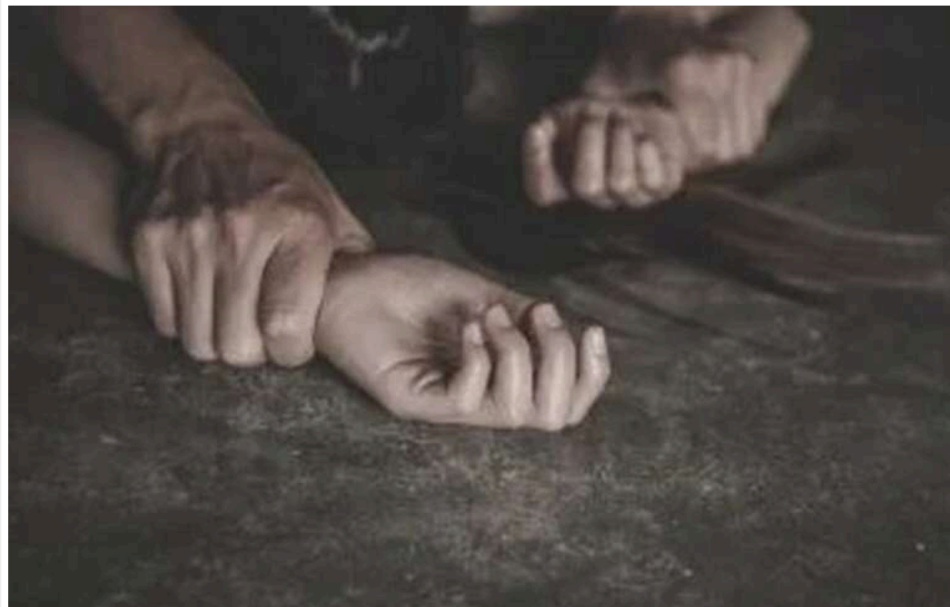
Поліція повідомила підозру трьом окупантам у зґвалтуванні жінки в Ягідному

Головне управління нацполіції у Чернігівській області повідомило підозри в порушенні законів і звичаїв війни трьом військовослужбовцям збройних сил Російської федерації.