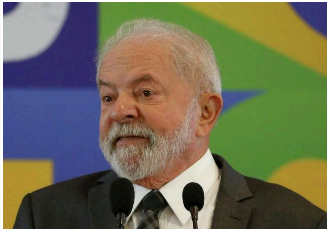
Президент Бразилії Лула да Сілва скасував поїздку в РФ на саміт БРІКС

Через отримані травми при падінні у ванній.