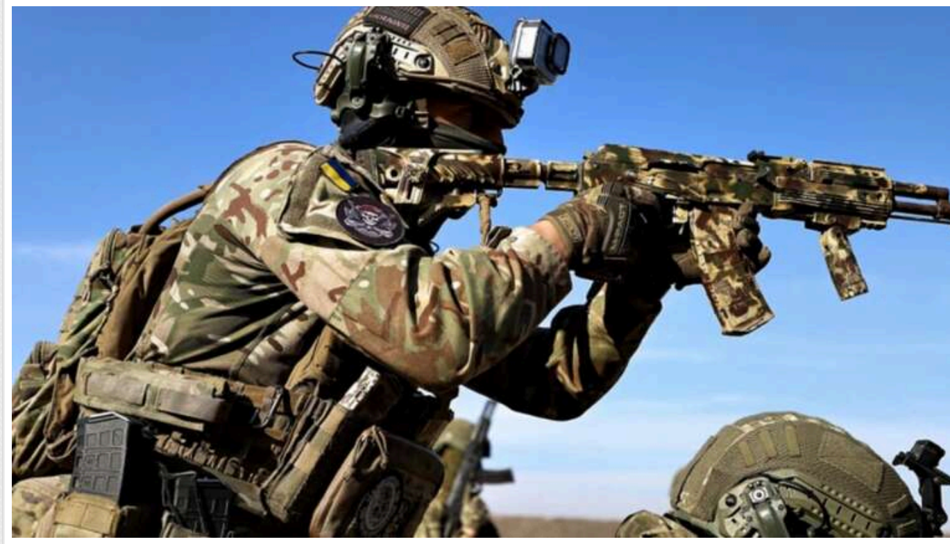
ЗСУ над Курською областю збили небезпечний російський дрон

Галицькі десантники знищили російський розвідувально-ударний БПЛА "Оріон". Небезпечний дрон було ліквідовано в небі над Курською областю.