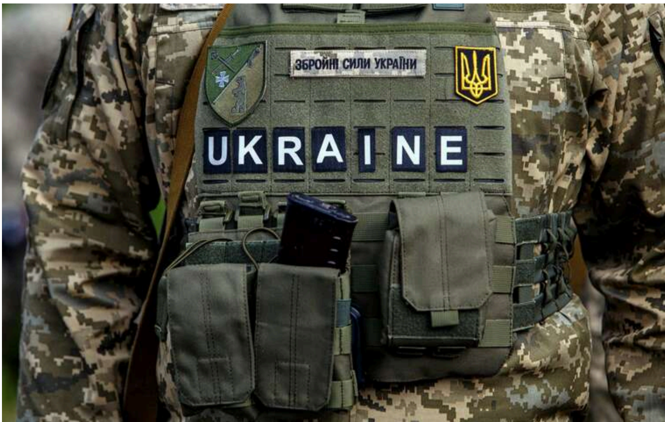
Мін'юст нарешті залучив юристів для МО, аби стягнути заборгованості за бронжилети, які не були поставлені ще у 2022 році

Міністерство юстиції України 15 липня та 9 жовтня уклало дві угоди з юридичними фірмами про надання юридичних послуг для Міноборони стосовно судових позовів щодо невиконання поставок бронжилетів у 2022 році.