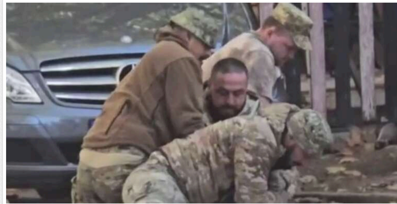
Силова мобілізація чоловіка в Миколаєві: у ТЦК спростували свою причетність

У Миколаївському обласному ТЦК та СП заперечили участь своїх співробітників у інциденті, відео з якого поширюється серед миколаївської аудиторії в соціальних мережах.