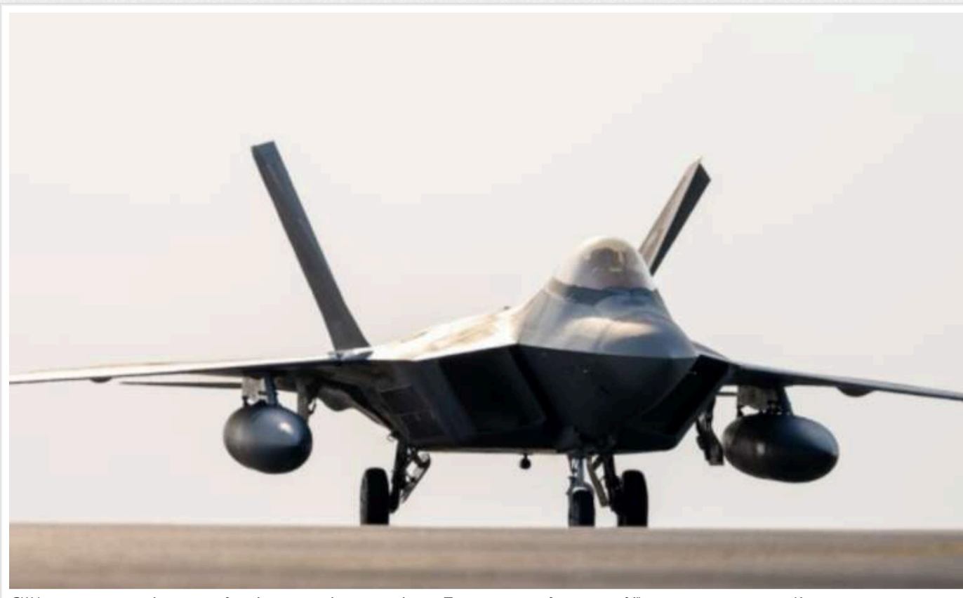
США оновлюють злітно-посадкові смуги в кількох регіонах Тихого океану для протидії розширенню впливу Китаю

Американські військові здійснюють модернізацію злітно-посадкових смуг у різних регіонах Тихого океану, щоб мати змогу розосередити бойову авіацію та підвищити її шанси на виживання під час гіпотетичного воєнного конфлікту з КНР.