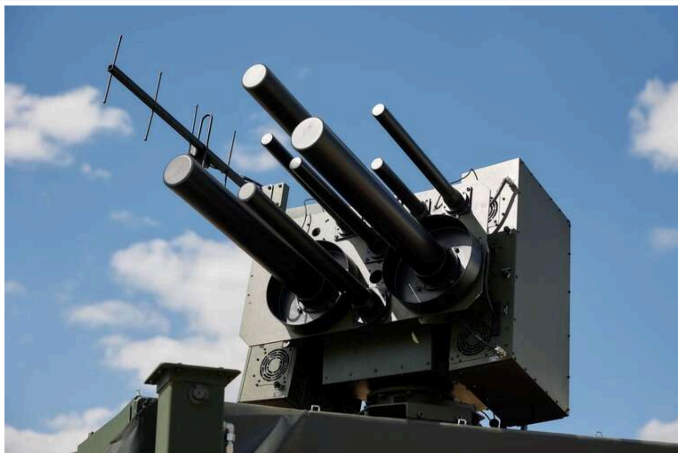
The Times: Україна щомісяця винаходить нові РЕБ

Нові технології необхідно створювати всього за кілька тижнів, щоб ефективно протистояти зброї ворога.