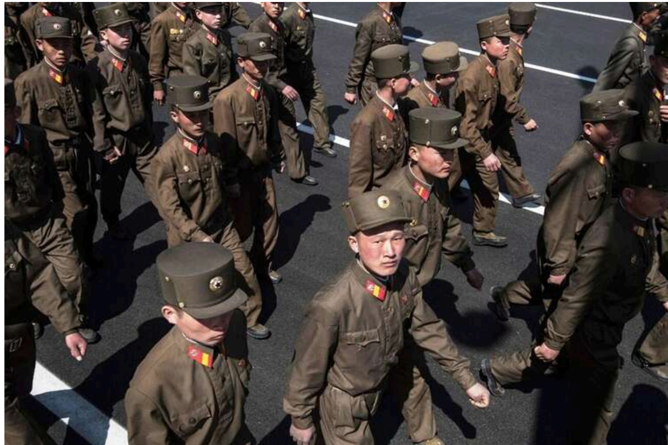
У Білому домі назвали ознакою відчаю Росії залучення армії КНДР до війни

Можливе залучення військ Північної Кореї до війни проти України вказує на те, що Росія у відчай. Кремль міг відатися до такого кроку через значні втрати на фронті.