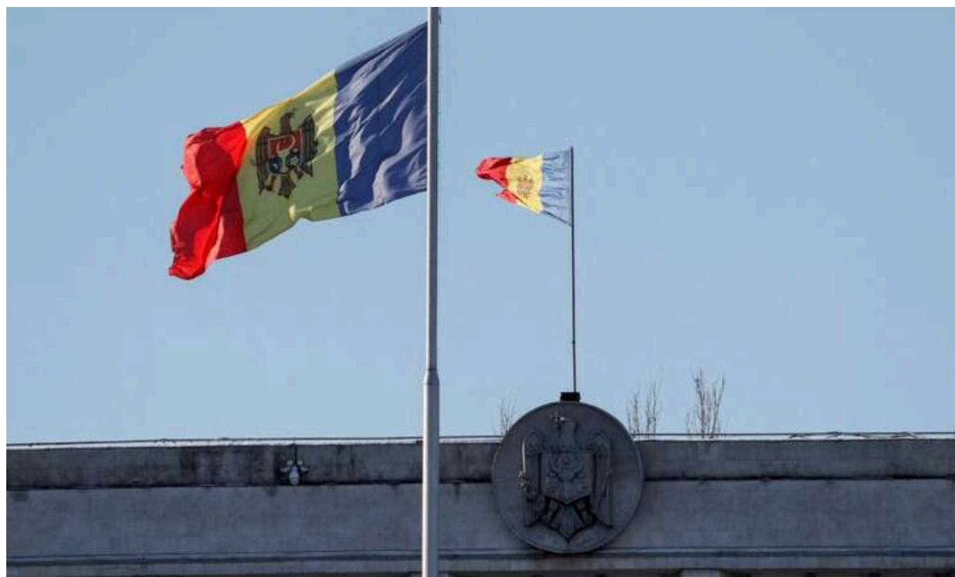
У Молдові люди почали отримувати фейкові повідомлення напередодні виборів

Завтра у Молдові пройдуть президентські вибори та референдум. Напередодні цих подій люди все частіше почали отримувати фейкові повідомлення у месенджерах.