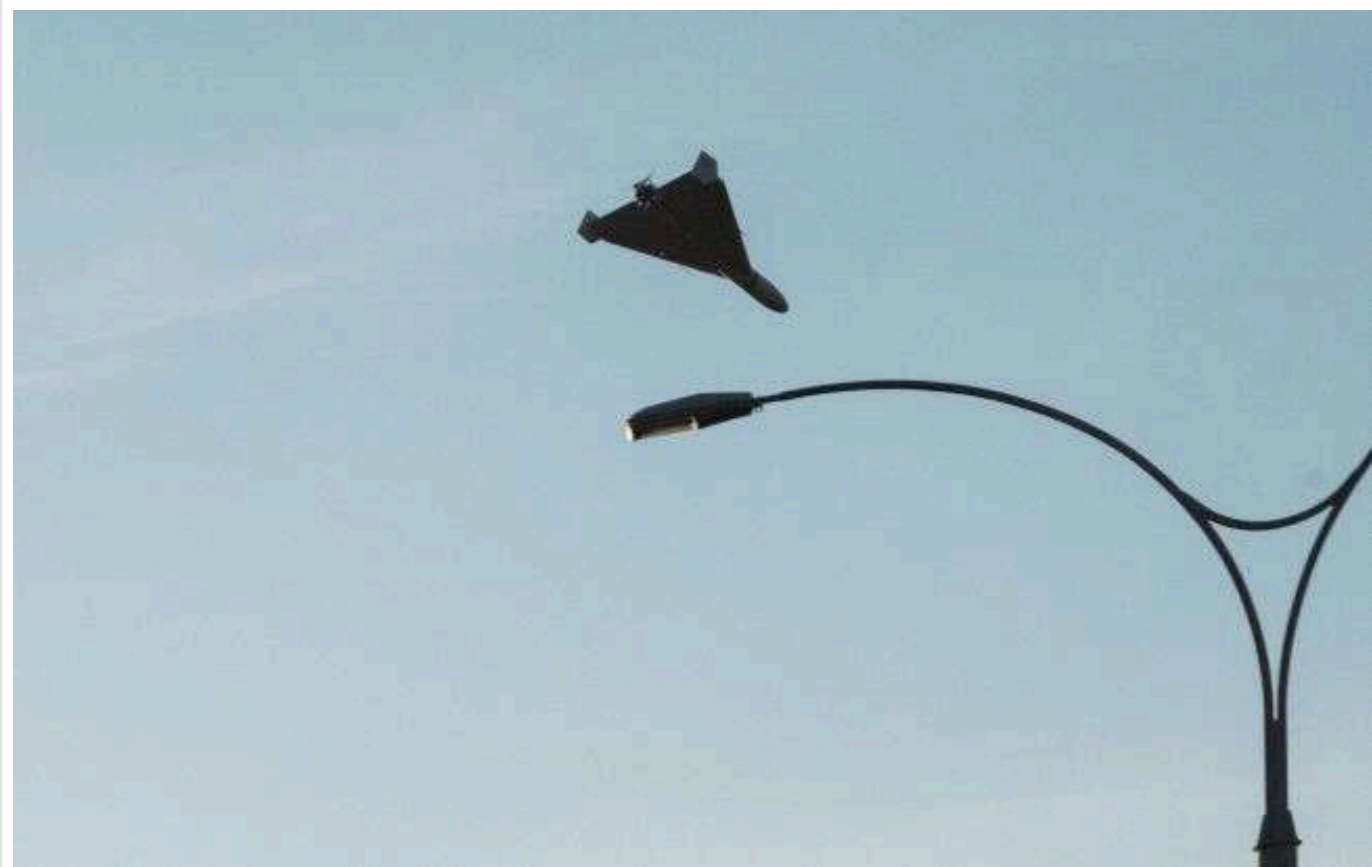
У КОВА розповіли про наслідки атаки РФ на Київщину: Сили ППО відпрацювали успішно

У ніч на 19 жовтня Росія знову атакувала Київщину за допомогою дронів-камікадзе. В області ефективно діяли сили ППО, було збито ворожі об'єкти.