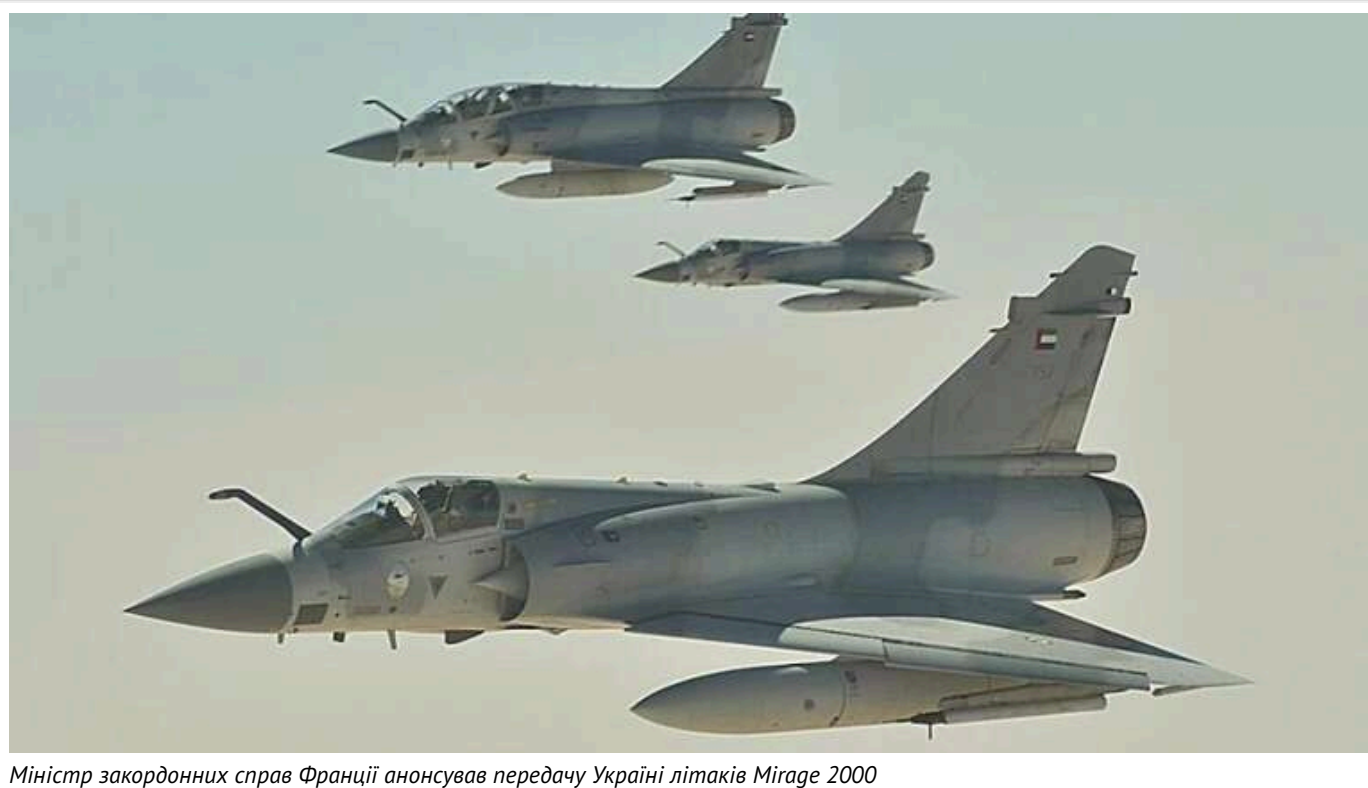
Міністр закордонних справ Франції анонсував передачу Україні літаків Mirage 2000

Міністр закордонних справ Франції Жан-Ноель Барро прибув до України та оголосив про передачу винищувачів Mirage 2000. За його словами, Повітряні сили України отримають першу партію бойових літаків уже наступного року.