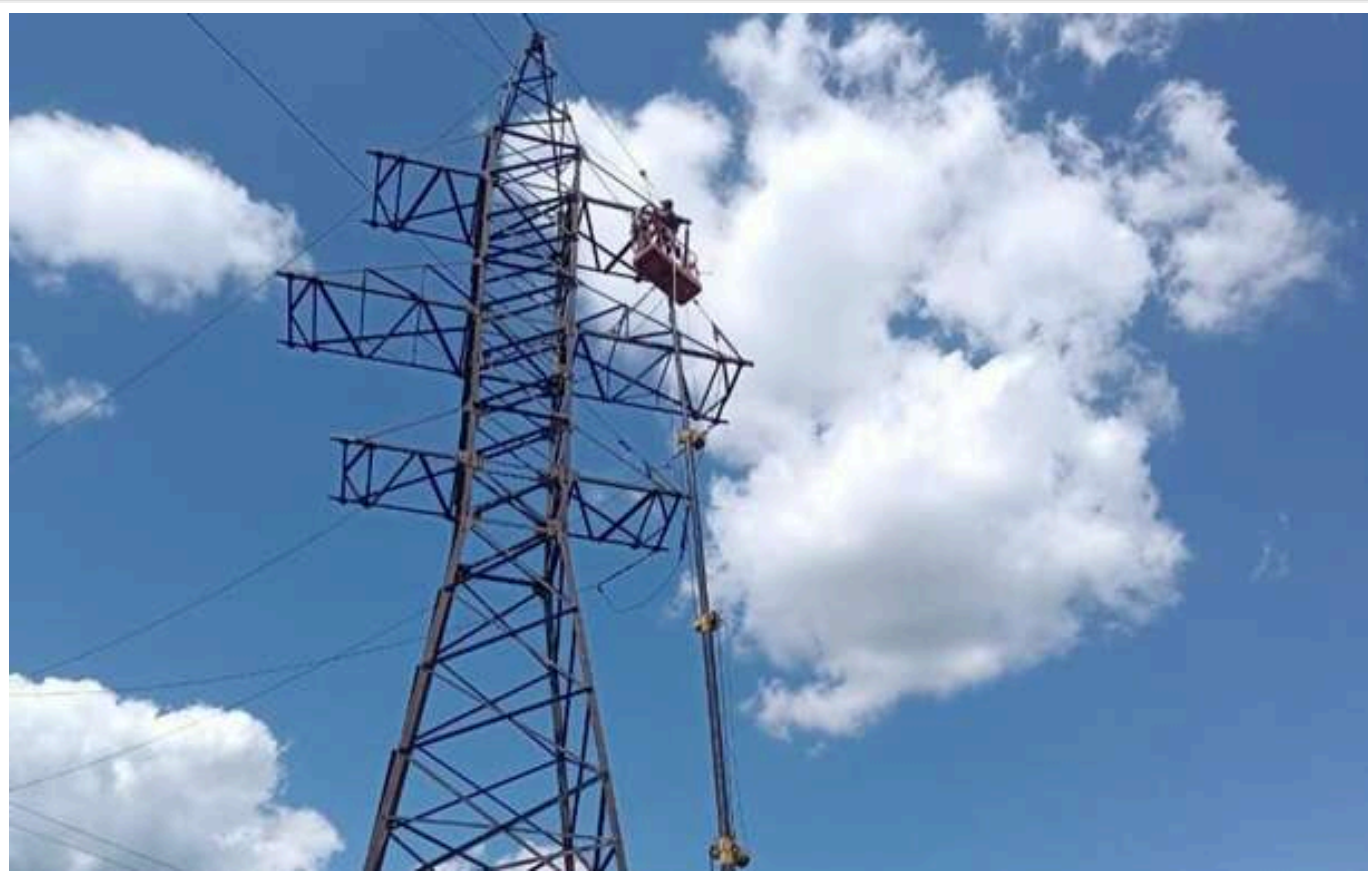
У двох регіонах України запроваджено аварійні відключення електроенергії