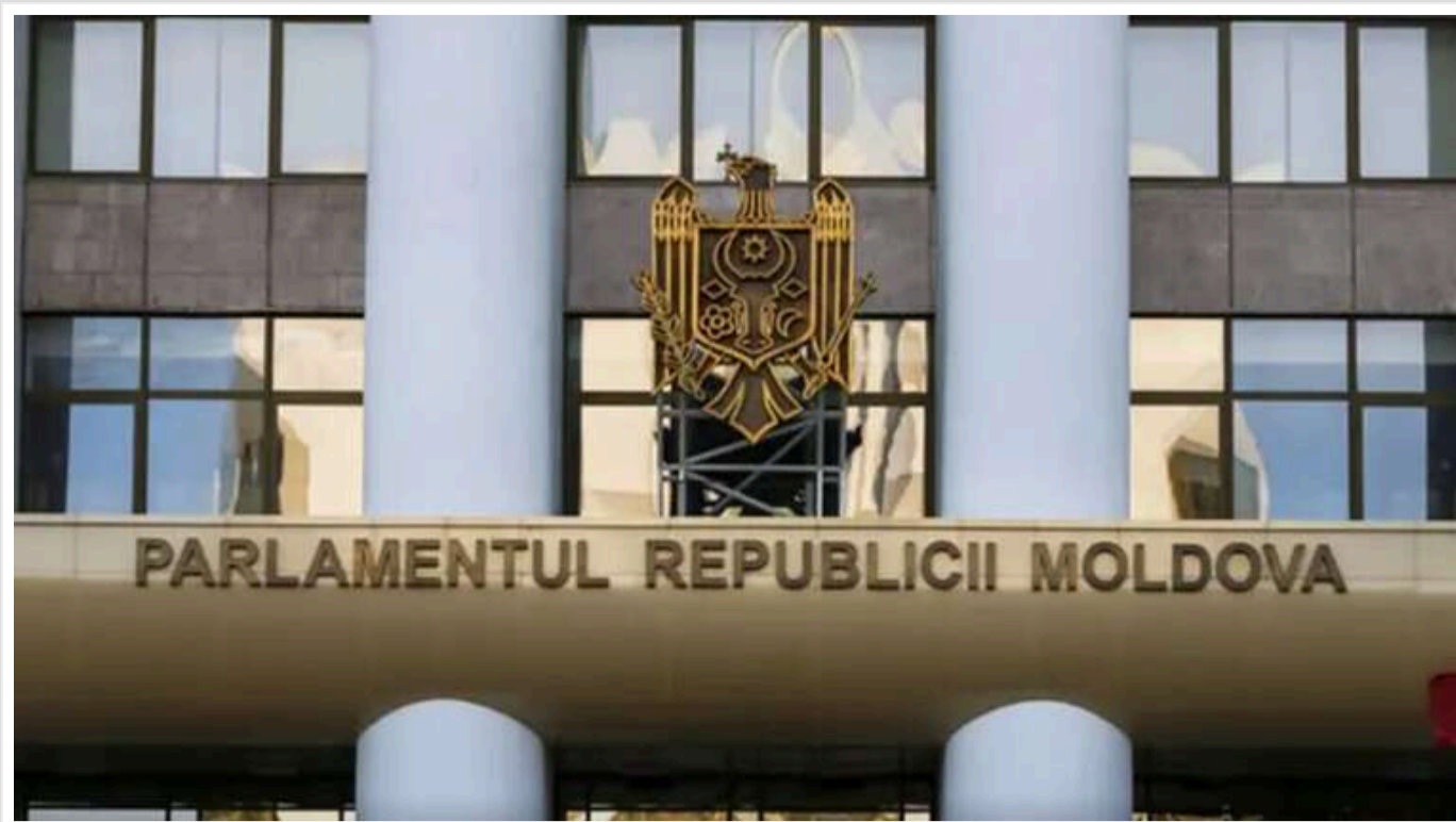
У Молдові парламент зазнав кібератаки

Фахівці з'ясовують причину та наслідки кібератаки.