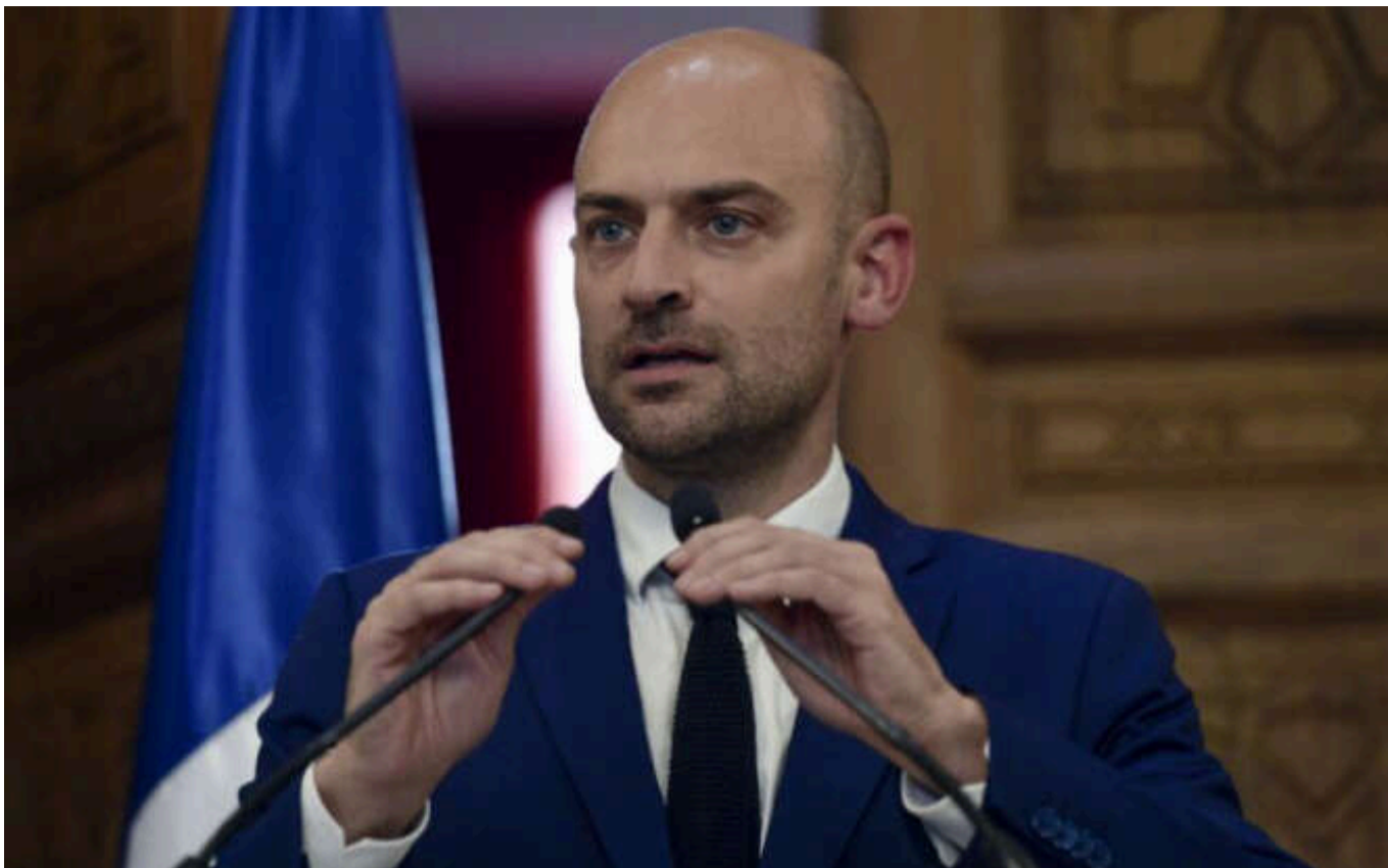
Франція підтримує План перемоги України, - Жан-Ноель Барро

Франція підтримує план перемоги України у війні з Росією. Париж готовий продовжувати допомагати Україні.