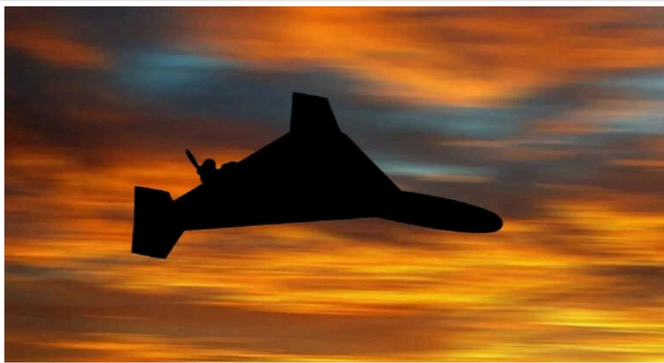
У Румунії вночі піднімали винищувачі внаслідок порушення повітряного простору безпілотником

У Румунії в ніч на суботу, 19 жовтня, чотири винищувачі були підняті в повітря через перетин кордону російським безпілотником.